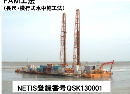
FAM工法 (長尺・横行式水中施工法)