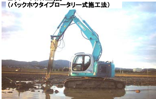
BH-RM工法 (バックホウタイプロータリー式施工法)