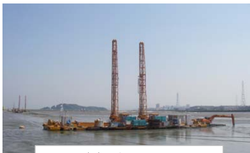
FVM工法 (長尺・横行式泥上施工法)