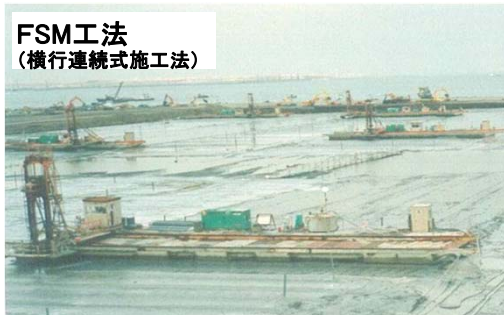
FSM工法 (横行連続式施工法)