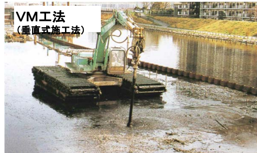
VM工法 (垂直式施工法)